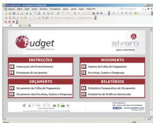
Janela inicial do programa BUDGET

Consiste em um sistema desenvolvido no Microsoft Excel, para atender as necessidades de empresas, especialmente laboratórios de Análises Clínicas, que desejam gerenciar seus resultados, com a utilização da ferramenta de planejamento orçamentário e com acompanhamento periódico.