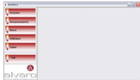
Janela principal do sistema soroteca

O sistema Soroteca foi desenvolvido pela unidade de TI do Alvaro - Centro de Análises e Pesquisas Clínicas.